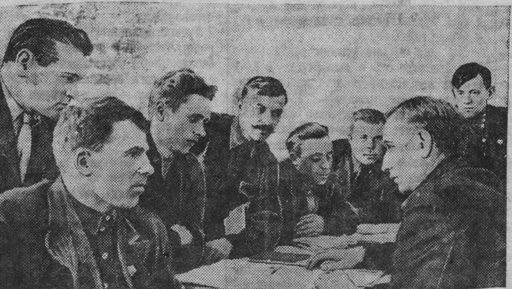
Парторганизация агитного рудника им. С. М. Кирова (гор. Кировск, Ленингр. обл.) организовала для группы сочувствующих горняков кружок, в котором они изучают материалы, связанные с подготовкой к выборам в Верховный Совет РСФСР. На снимке: кружок приступает к изучению новой темы — «Наша родина».