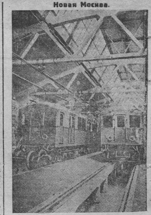
На снимке: первые секции вагонов для Горьковского радиуса метро, полученные вагонным депо второй очереди метрополитена в поселке «Сокол».

ФИЛЬМ О ГЕРОИЧЕСКОМ РЕЙДЕ. Первая Конная армия, выступавшая товарищами И. В. Сталиным и К. Е. Ворошиловым, вписала немало славных страниц в историю вооруженной борьбы рабочих и крестьян с врагами молодой советской республики. Одной из самых замечательных операций красной конницы явился беспримерный героический рейд Первой Конной армии против панской Польши в 1920 году, во время третьего похода Антанты. Этому историческому рейду посвящается художественный фильм «Первая Конная». Комитет по делам кинематографии при Совнаркоме СССР, поручил создание сценария фильма писателю-орденоносцу В. С. Вишневскому, а постановку — режиссеру-орденоносцу Е. Дзигану. Сценарий фильма «Первая Конная» предполагается закончить в августе. Это даст возможность выпустить фильм к 1 мая 1939 года. (ТАСС).