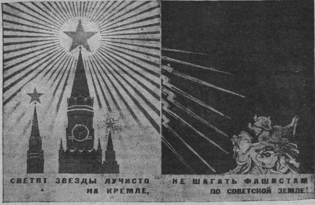
На снимке: Новый плакат художника Б. Пророкова, выпущенный Изогиз'ом. Текст Н. Черемных.