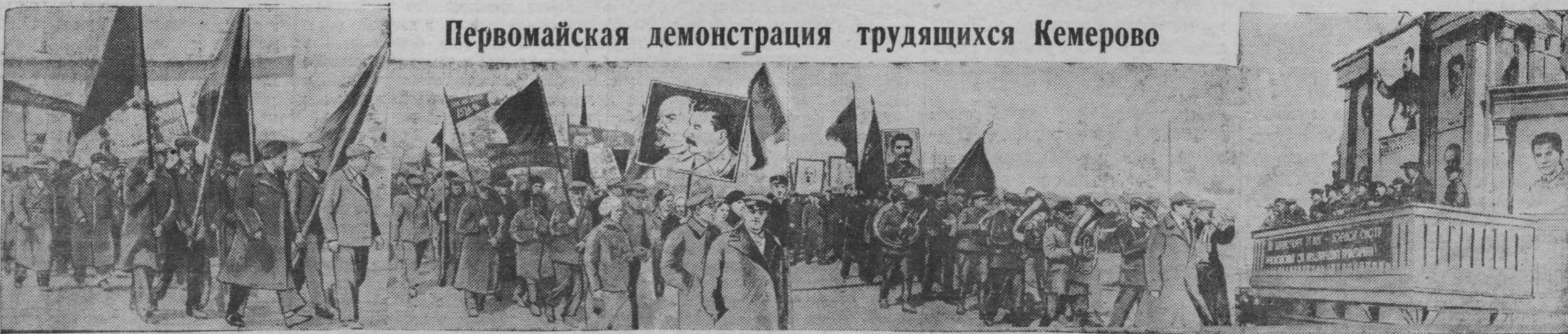
Первомайская демонстрация трудящихся Кемерово