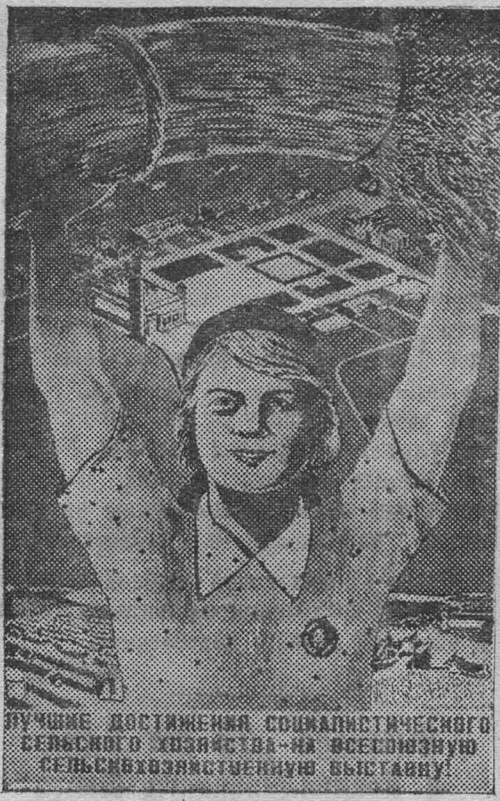
На снимке: плакат работы художника А. Мартынова, выданный Изогризом в связи с подготовкой к открытию Всесоюзной сельскохозяйственной выставки.

Такая медлительность с началом сева может привести колхоз к большой затяжке посевной. М. ГУСЕВ.