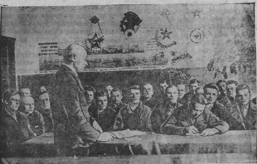
Отчетно-выборное партийное собрание на мехзаводе. Секретарь парткома тов. Сотников делает отчетный доклад о работе парткома.