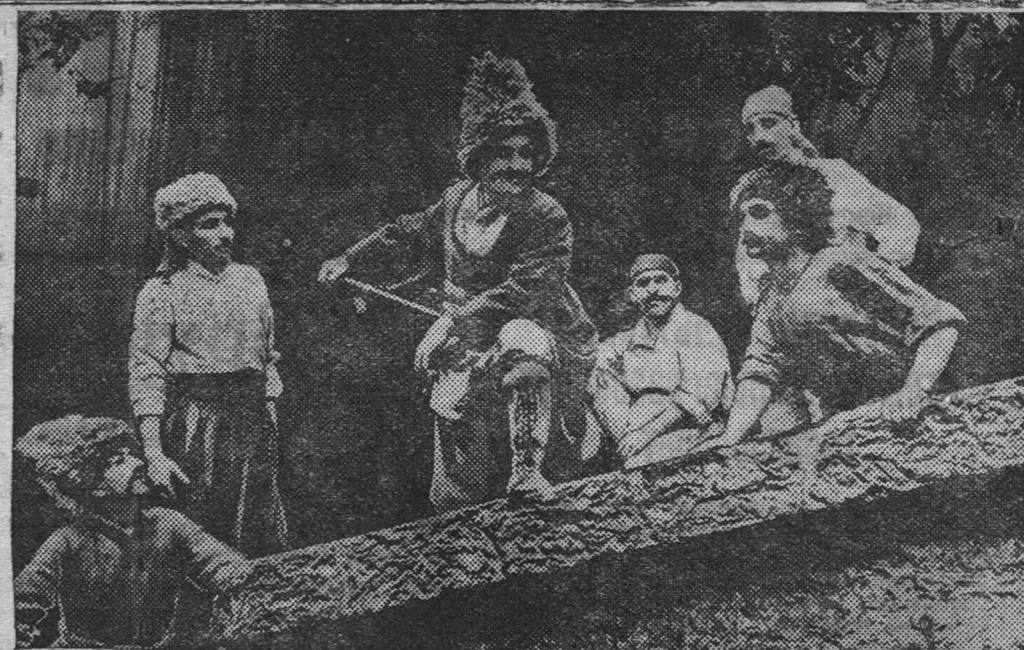
2 апреля в филиале Государственного ордена Ленина Академического Большого театра СССР (Москва) состоялась генеральная репетиция оперы «Кероглы» в постановке Азербайджанского Государственного театра оперы и балета им. М. Ф. Ахундова. Музыка народного артиста АЗСР Узера Гаджибекова. На сцене: Сцена из 1 действия «Кероглы».