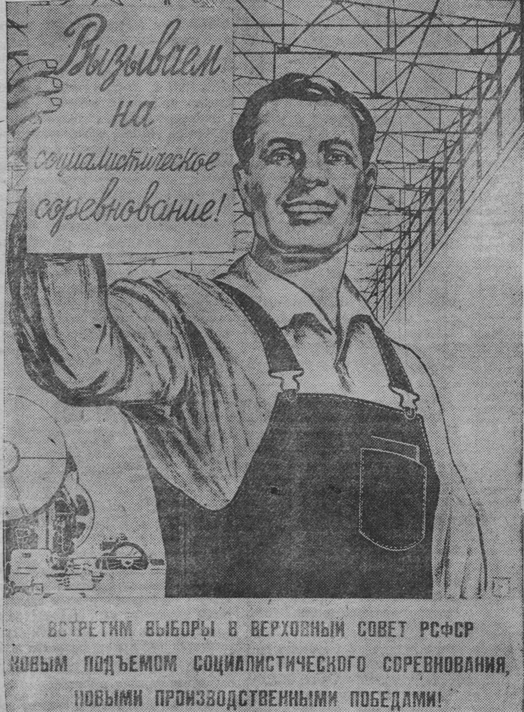
К предстоящим выборам в Верховный Совет РСФСР Изогизом выпущен ряд красочных плакатов. На снимке: Плакат работы худ. Н. Денисова, В. Правдина, П. Вахлановой и З. Правдиной. «Встретим выборы в Верховный Совет РСФСР новым подъемом социалистического соревнования, новыми производственными победами». (Даша с «Семки» апрель 38 г.)