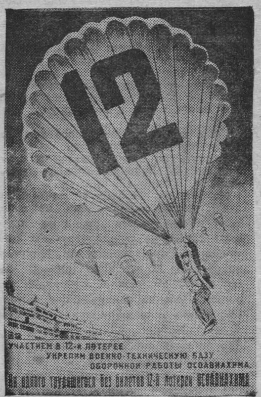
Для успешной реализации билетов 12-й лотереи Осовавиахима издательство Центрального Совета Осовавиахима выпустило агитационную литературу, красочные плакаты и листовки. На снимке: плакат работы художника А. Вельского, выпущенный к 12-й лотерее Осовавиахима.