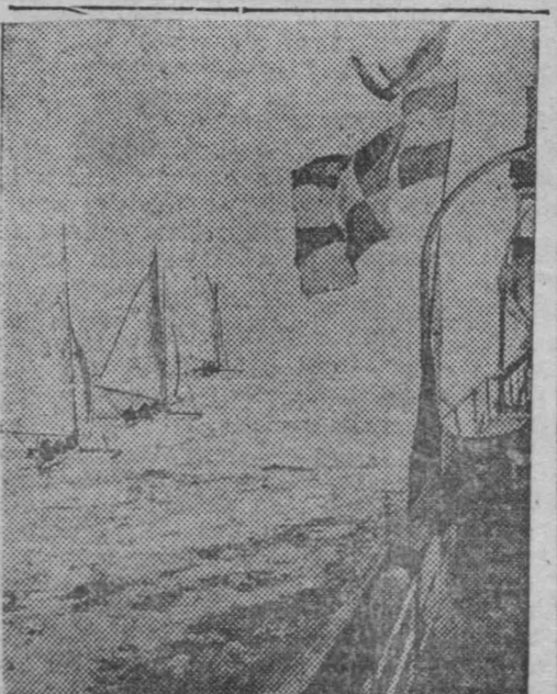
На снимке: Буера, встретившие близ Кринштада героическую четверку папанинцев.

Во время полета ничего не обнаружено. (ТАСС).