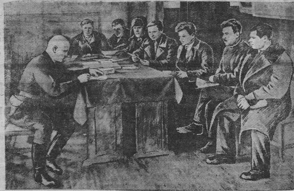
Группа агитаторов агитколлектива коксохимзавода перед каждым выходом на участок № 2 собирается в агит-пункте, где производится учет выхода агитаторов, раздается литература, даются указания по проведению беседы.