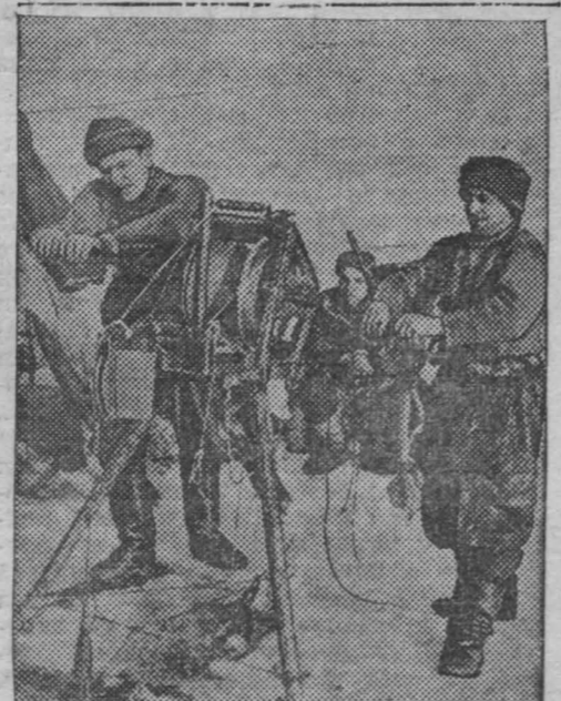
На снимке: Работа у гидрологической лебедки на дрейфующей станции «Северный полюс». Слева направо — Э. Т. Кренкель и Герой Советского Союза И. Д. Папанин, сзади Е. К. Федоров. (Снято в августе 1937 г.)

Еще с утра город был украшен праздничному. Воюю красные флаги, портреты вождя партии и правительства, героев-полярников, лозунги, транспаранты с приветствиями победителям ледяных просторов Арктики. Большие плакаты изображают станцию «Северный полюс» на дрейфующей льдине.