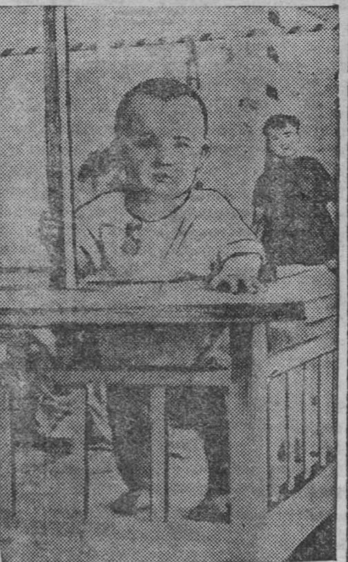
Маленький гражданин Советского Союза.

Для популяризации среди населения мероприятий по борьбе с летними заболеваниями детей организуются цикл бесед врачей по радио, выпускается звуковой фильм «Дизентерия», диапозитивы к нему подобные.