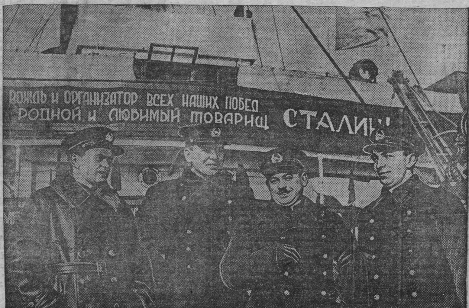
15 марта 1938 года трудящиеся города Ленина горячо встретили отважных завоевателей Северного полюса: Героя Советского Союза И. Д. Палапина, Э. Т. Кренкеля, П. П. Ширшова и Е. К. Федорова, блестяще выполнивших сталинское задание. На снимке: Товарищи И. Д. Палапин, П. П. Ширшов, Э. Т. Кренкель и Е. К. Федоров на борту ледокола «Ермак».