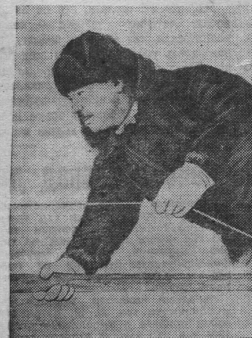
На снимке: И. Д. Папанин. (Кадр из фильма «На Северном полюсе»).

Да здравствует наш великий народ! Да здравствует вождь, победитель, инициатор завоевания Северного полюса родной и любимой товарищ Сталин!