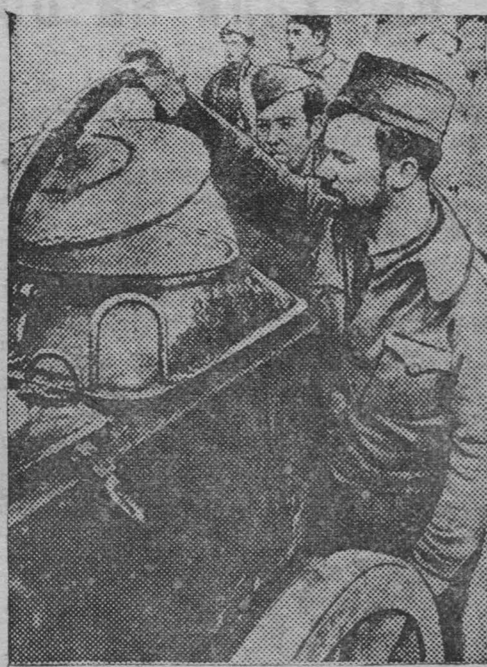
На снимке: повар республиканской части готовит обед республиканским бойцам.

16 марта фашистская авиация бомбардировала на побережье Средиземного моря города Кастельон де ла Плана, Сан Висенте де Кальдеро и несколько деревень близ Таррагона. Имеются жертвы. Вечером 15 фашистских самолетов произвели налет на Барселону. Несколько бомб упало в центр города. Насчитывается 20 убитых и 50 раненых.