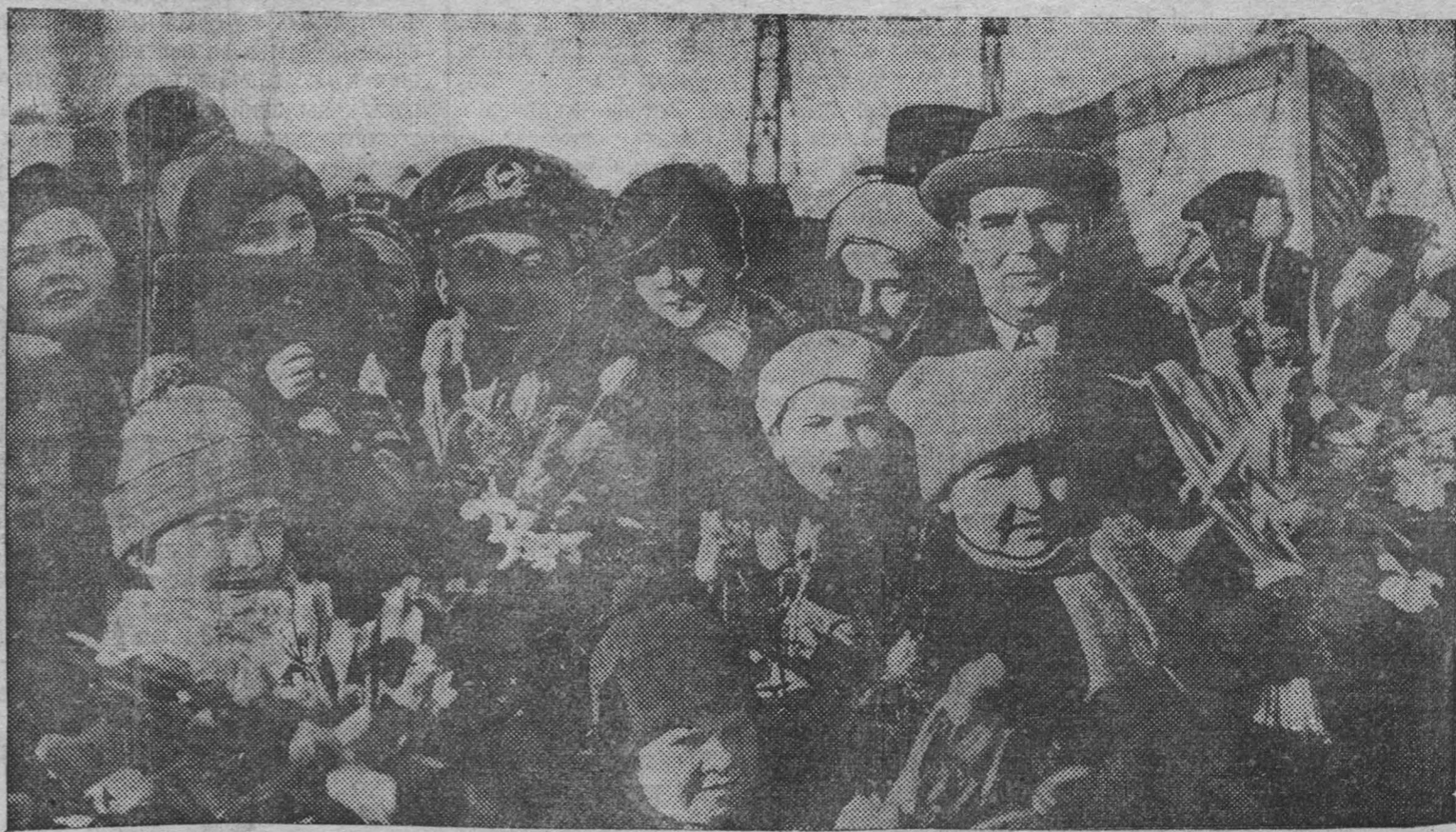
На снимке: Встреча папанинцев в Таллине (Эстония). Папанин среди жителей советской колонии в гавани Таллина. (Дата с'емки 11 марта 1938 г.)