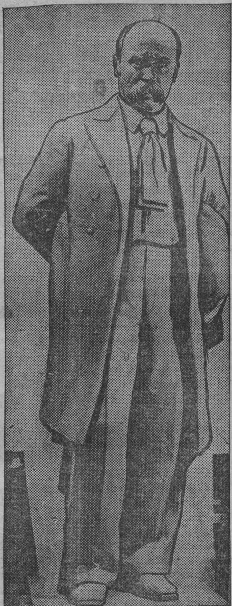
В Ленинградской мастерской заслуженного деятеля искусств профессора М. Маннзера изготовлена монументальная 6-метровая скульптурная фигура Т. Г. Шевченко. Скульптура предназначается для памятника, который будет установлен в Кизве к 125-летию юбилею со дня рождения великого украинского поэта-революционера.