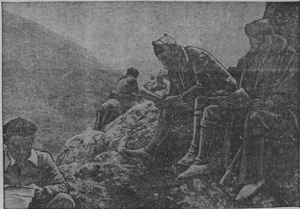
Культурная работа среди бойцов республиканской Испании. На снимке: бойцы республиканской армии в перерыве между боями читают газеты и журналы, присланные Домом культуры.