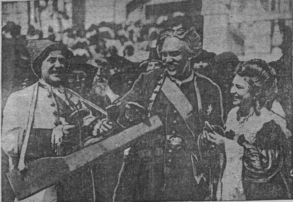
Вторая серия фильма «Петр Первый» производства «Ленфильм». Режиссер — заслуженный артист республики орденосец В. М. Петров. На снимке: Клар из фильма. На Троицкой площади. В центре — Петр — артист-орденосец Н. К. Сим нов. Екатерина — народная артистка СССР орденосец А. К. Тарасова и Меньшиков — заслуженный артист республики орденосец В. И. Жаров.