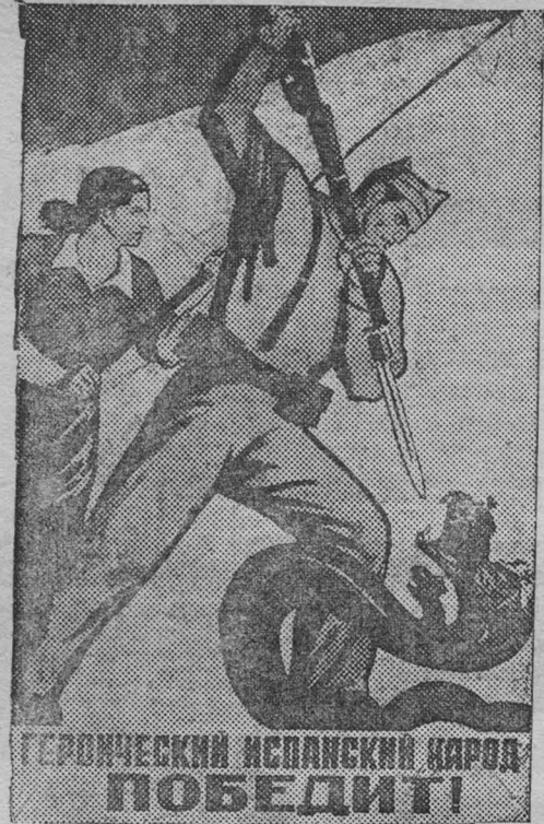
Героический испанский народ победит! — ра ота художников Долгополова и Узбекова, выпущенный издательством «Искусство» к XXI годовщине Великой Октябрьской социалистической революции.

27 октября сез. тал. № 12. Тропа шпиона. 28 октября сез. тал. № 13. Ночь в сентябре. 29 октября закрытый спектакль сезонный талон не действителен. 30 октября днем ЧАПАЕВ и вечером Начало в 8 часов, касса с 4 часов. 30 днем начало в 12 касса с 10 часов. Сезонный талон днем—14, вечером—15.