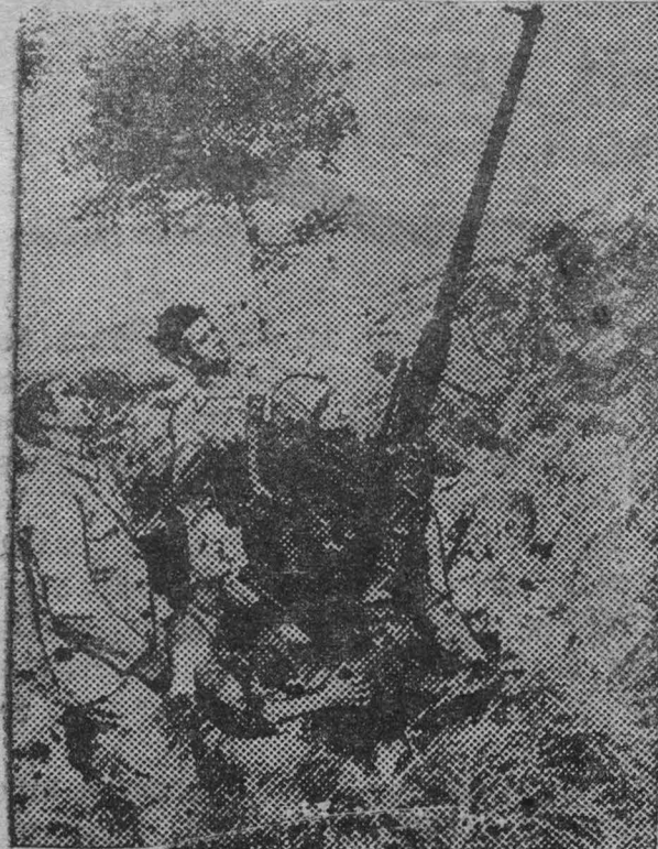
В республиканской Испании. На снимке: Наводка зенитного орудия на самолеты итапо-германских интервентов (Восточный фронт).