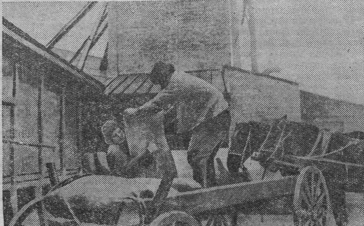
На сыпном пункте Кемеровского Заготзерно. Колхозники сельхозартели им. Пушкина, Мозжухинского сельсовета, сдают хлеб государству в счет натуроплаты за работу МТС.

Руководители колхозов и совхозов, партийные организации должны так организовать работу, чтобы, завершая хлебоуборку и хлебодачу, одновременно убрать картофель и до осенних заморозков полностью выполнить план государственных картофелепоставок.