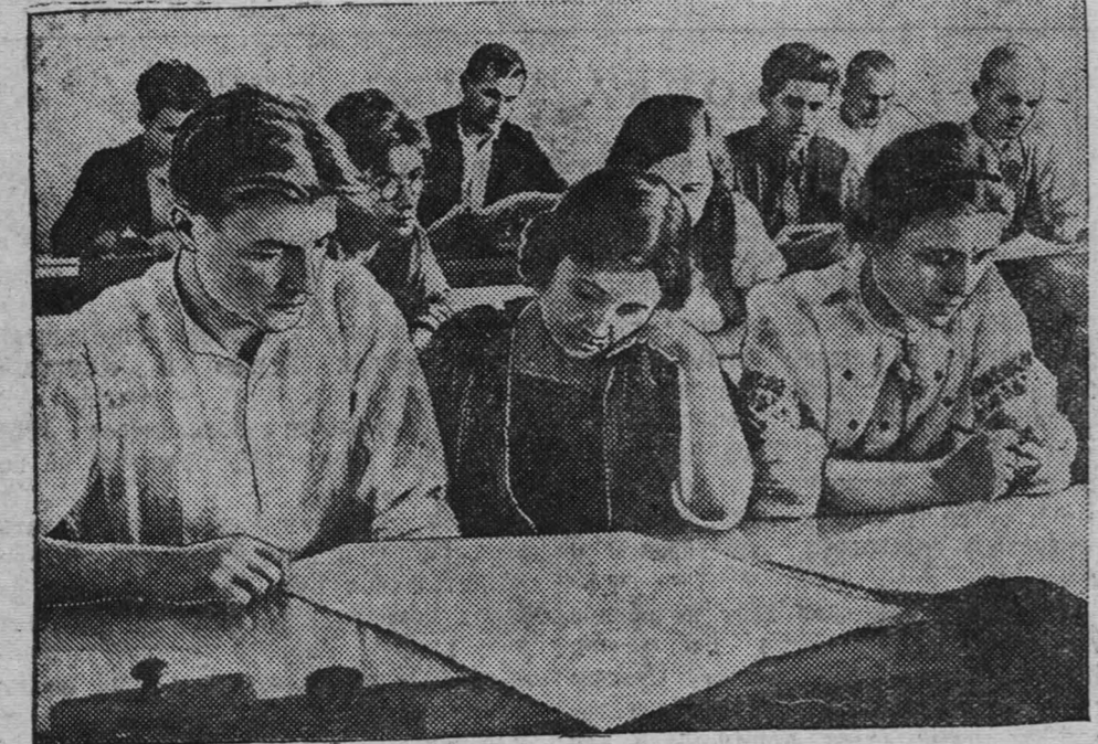
Слушатели Московской областной школы пропагандистов МК и МГ ВКП(б) приступили к изучению Краткого курса истории Всесоюзной Коммунистической Партии (большевиков), печатаемого в «Правде». На снимке: Слушатели школы изучают по «Правде» вторую главу Краткого курса.

Все партийные организации должны приложить максимум усилий к тому, чтобы образцово подготовить всю сеть партийного просвещения к изучению Краткого курса истории ВКП(б).