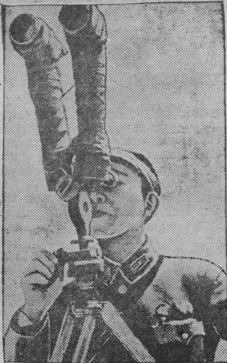
К военным действиям в Китае. На снимке: боец-артиллерист китайской армии наблюдает за действиями противника.

По словам печати, Гитлер во время встречи с Чемберленом решительно потребовал «самоопределения» для судетских немцев. Это требование и является основной темой совещания английских и французских министров. (ТАСС).