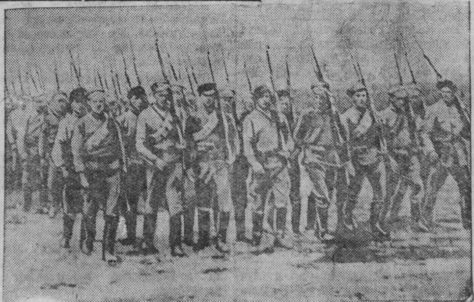
К XX-летию Ленинско-Сталинского комсомола. На снимке: Отправление отряда молодых рабочих-красноармейцев в 1918 г. на фронт. (Центральный музей РККА). Союзфото.

Сообщая об этом, редакция исправляет допущенную ею ошибку.