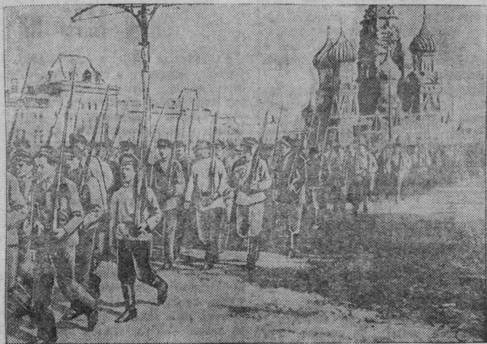
К XX-летию Ленинско-Сталинского комсомола. На снимке: Парад частей Всесоюзной комсомольской организации в мае 1918 г. на Красной площади в Москве.