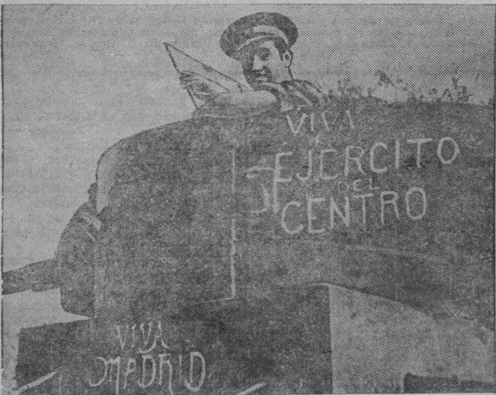
В республиканской Испании. На снимке: Танкист республиканской армии. На танке надпись: «Да здравствует армия Центрального фронта!». «Да здравствует Мадрид!».

при поддержке партизанских отрядов, выбили японцев из Финлианду на северном берегу реки Хуанхэ. В Южном Китае 8 сентября 8 японских самолетов подвергли бомбардировке Кантон - Коулуискую железную дорогу и ближайшие населенные пункты. Среди мирного населения имеются жертвы. (ТАСС).