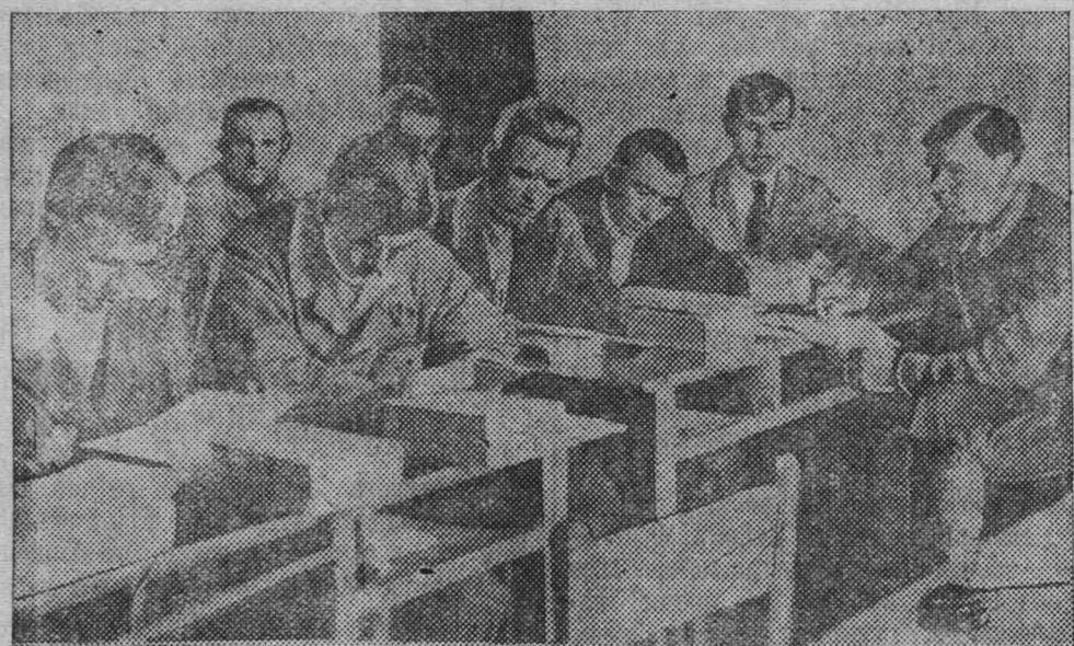
На снимке: Секретари парткомов и парторги на занятиях в Доме партпросвещения.