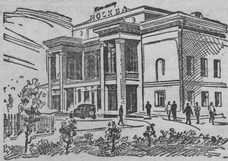
Кинотеатр „Москва“ Рисунок художника Скобликова.