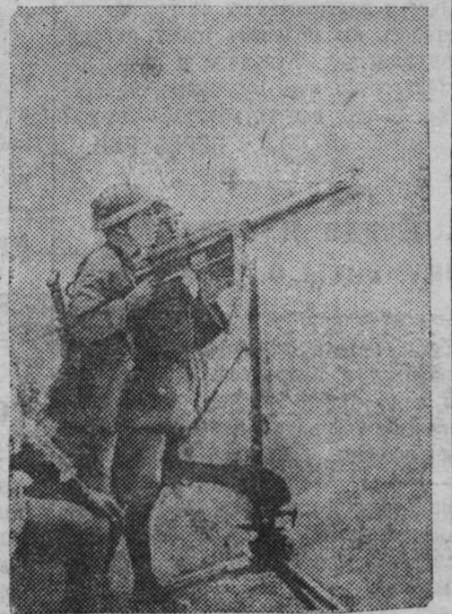
На снимке: бойцы китайской армии стреляют по самолетам противника.

— В Шанхае угрожающие размеры принимает эпидемия холеры. За последнюю неделю зарегистрировано 775 случаев заболевания. За неделю только на территории международного квартала умерло от холеры 174 человека. (ТАСС).