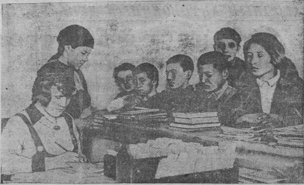
В библиотеке пионерского клуба.