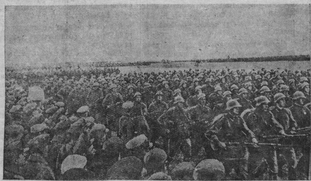
Красная Армия стоит на защите мира. На снимке: парад частей Красной Армии.