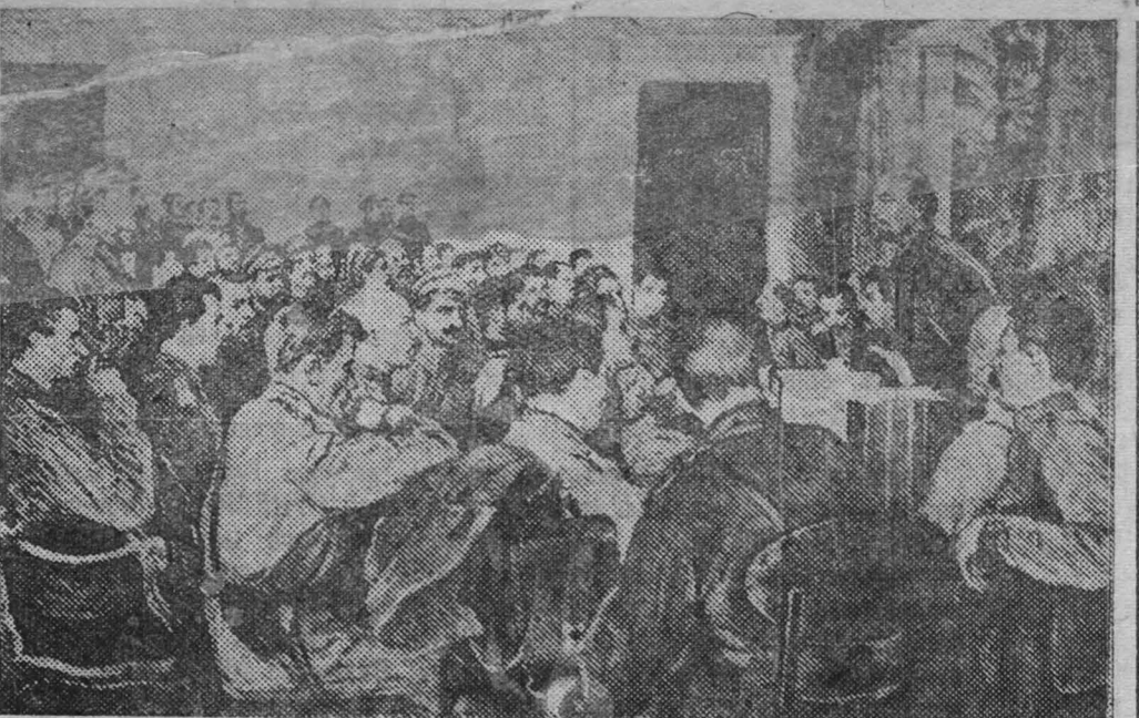
На снике: «Выступление В. И. Ленина на совещании военных организаций РСДРП (большевиков) в 1917 году». Картина художника Б. Е. Владимирского. Из новых картин, поступивших в Центральный музей В. И. Ленина.

Такое отношение к рабселькорам исходит от людей с мелкобуржуазными, бюрократическими правами, от людей, которые всеми средствами, вплоть до дикого преследования рабселькоров, стараются ограбить себя от критики и сохранить свое гнилое мешанское благополучие в ущерб общему, государственному делу. Такие люди заслуживают сурового судебного наказания.