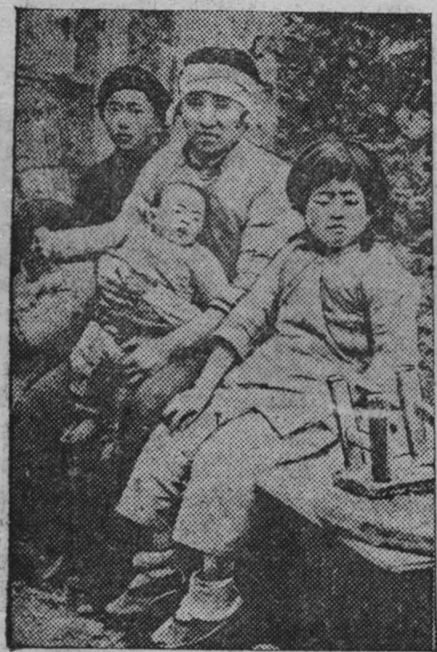
В военным действиям в Китае. На снимке: Муж убит, дом разрушен — семья осталась без кормильца и крова — таковы результаты очередной бомбардировки японскими захватчиками мирного населения Китая. Союзфото.

Вследствие непрерывающихся дождей, в северной части провинции Хэнань продолжается разлив реки Хуанхэ. В районе Цзюкоу (севернее Чжунмоу) водой затоплено более 280 деревень. Свыше ста тысяч населения осталось без крова. (ТАСС).