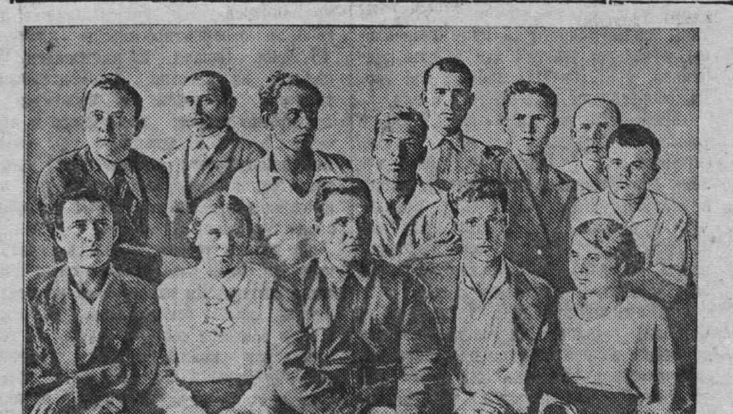
Группа агитаторов углеперогонного завода Фото Малышевского.

— Партийные организации нашей области, — заканчивает докладчик, — полны твердой решимости под руководством ЦК ВКП(б) и товарища Сталина беспощадно громить всех врагов народа, с большевистской энергией осуществлять решения партии и правительства, ведя неустанную борьбу за торжество коммунизма во всем мире.