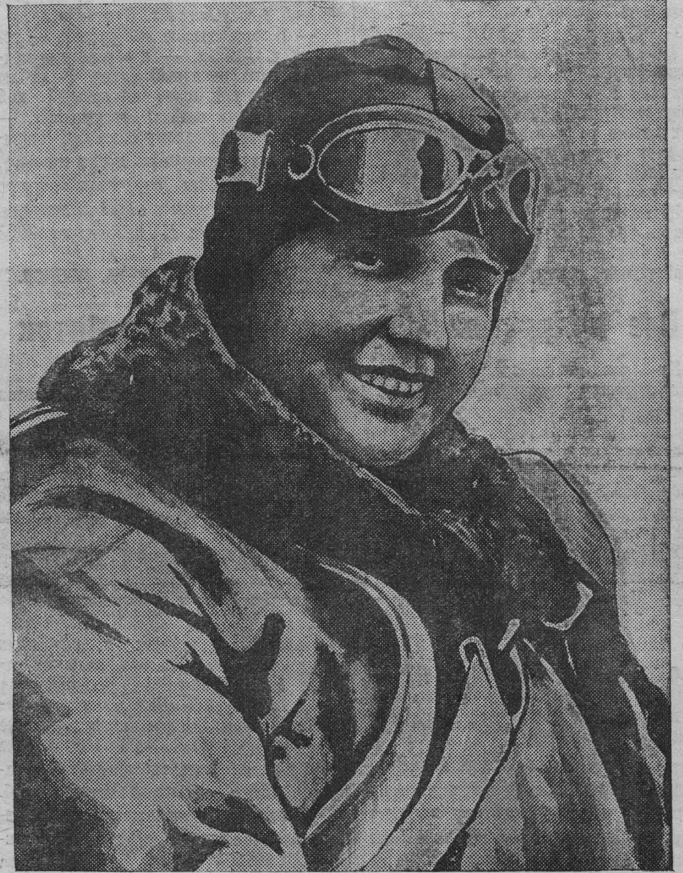
Военная летчица старший лейтенант ПОЛИНА ОСИПЕНКО.