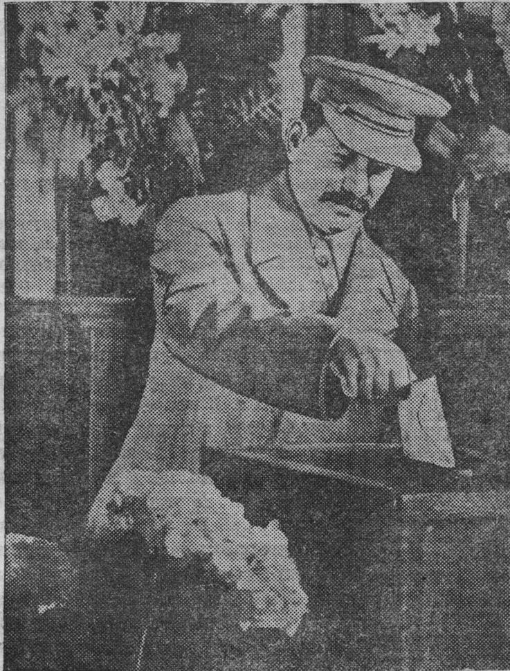
Выборы в Верховный Совет РСФСР 26 июня 1938 г. На снимке: в 58-м избирательном участке Ленинского избирательного округа г. Москвы. Товарищ И. В. СТАЛИН опускает конверт с бюллетенем в избирательную урну.

Подписка на «Заем Третьей Пятилетки» совпадает с окончанием избирательной кампании по выборам в Верховные Советы Союзных и Автономных республик, закончившейся блестящей победой сталинского блока коммунистов и беспартийных. Нет сомнения, что трудящиеся Кемерово, как и весь наш народ дружно, и в самые короткие сроки полностью закончат подписку на «Заем Третьей Пятилетки», который делает нашу родину еще краше, счастливее, могущественнее.