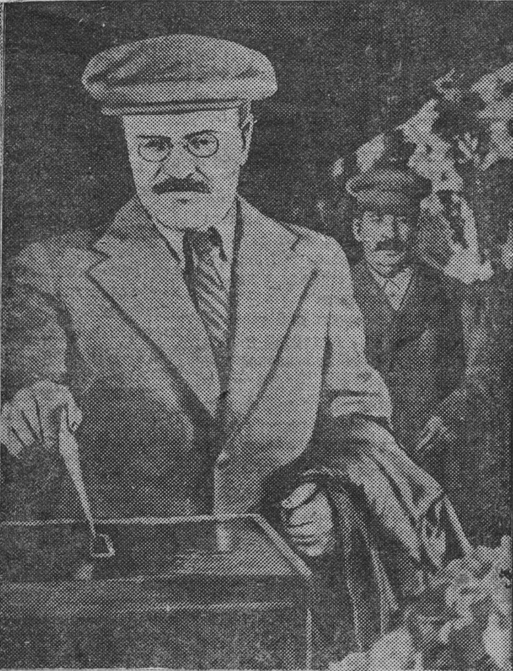
Выборы в Верховный Совет РСФСР 26 июня 1938 г. На снимке: в 58-м избирательном участке Ленинского избирательного округа г. Москвы. Товарищ В. М. МОЛОТОВ опускает конверт с бюллетенем в избирательную урну. Справа — товарищ И. В. СТАЛИН.