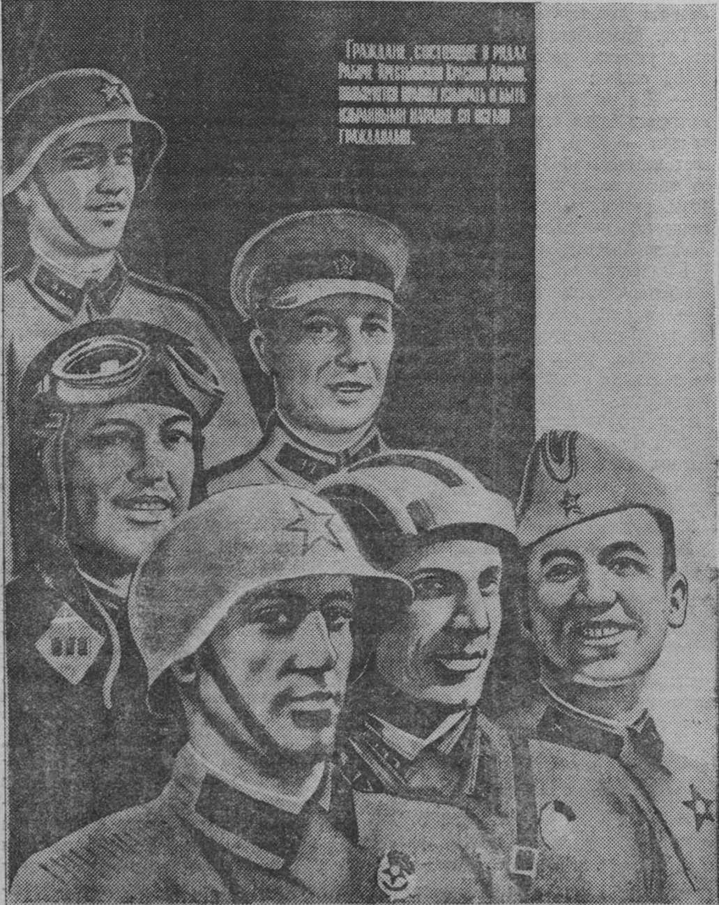
В Верховные Советы Союзных Республик Рабоче-Крестьянская Красная Армия пошлет лучших своих представителей, беззаветно преданных делу коммунизма, делу Ленина — Сталина

— Я, как и все другие избиратели нашего округа, счастлив, что голосовал за верного соратника товарища Сталина, за главу советского правительства Вячеслава Михайловича Молотова. Нашу радость, наше счастье вместе с нами разделяет весь грузинский народ.