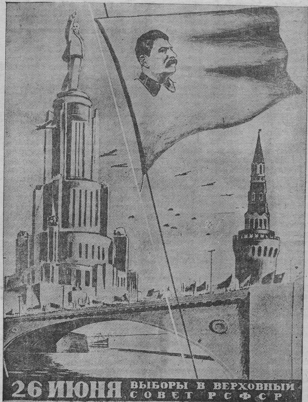
НА СНИМКЕ: Плакат работы художников Н. Жукова и С. Кованько, выпущенный Институтом изобразительной статистики (Изостат) ЦУНХУ Госплана СССР к предстоящим выборам в Верховный Совет РСФСР.