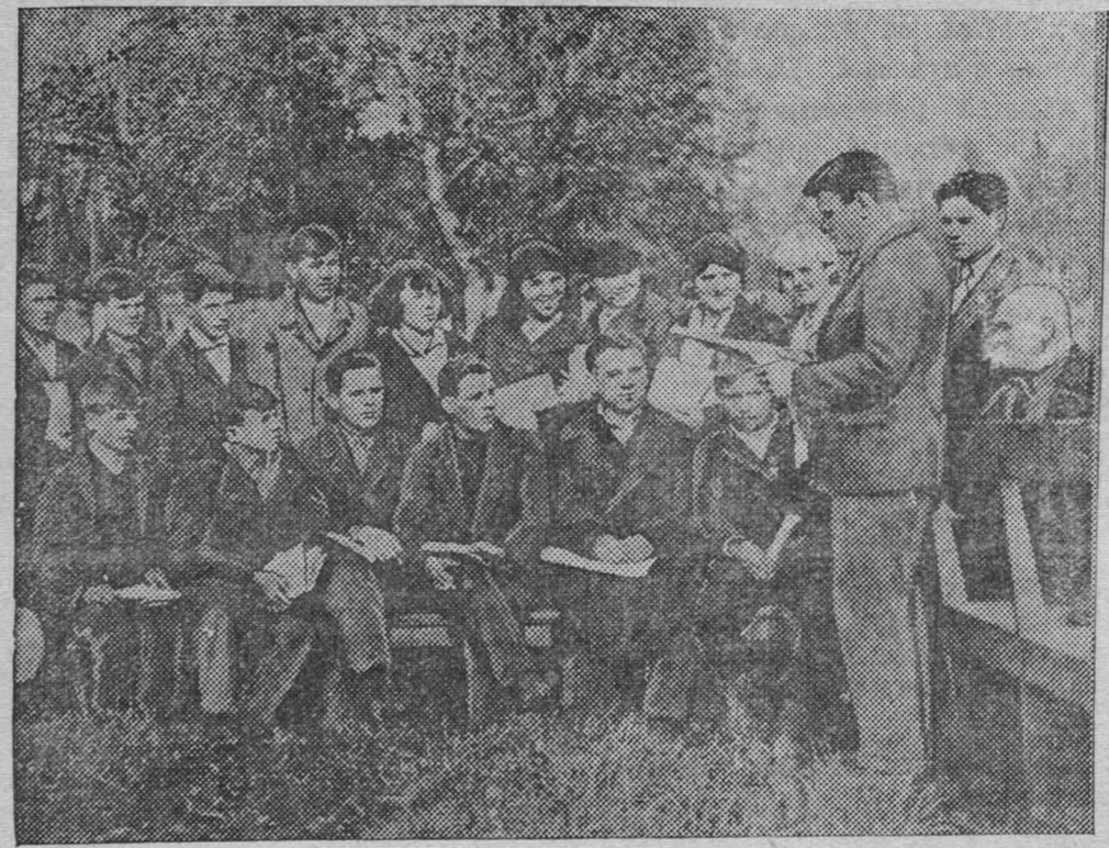
НА СНИМКЕ: семинар агитаторов коксхимзавода перед выходом на участок. Семинар проводит тов. Швецов.

Беседник 54 избирательного участка А. ГОЛОД.