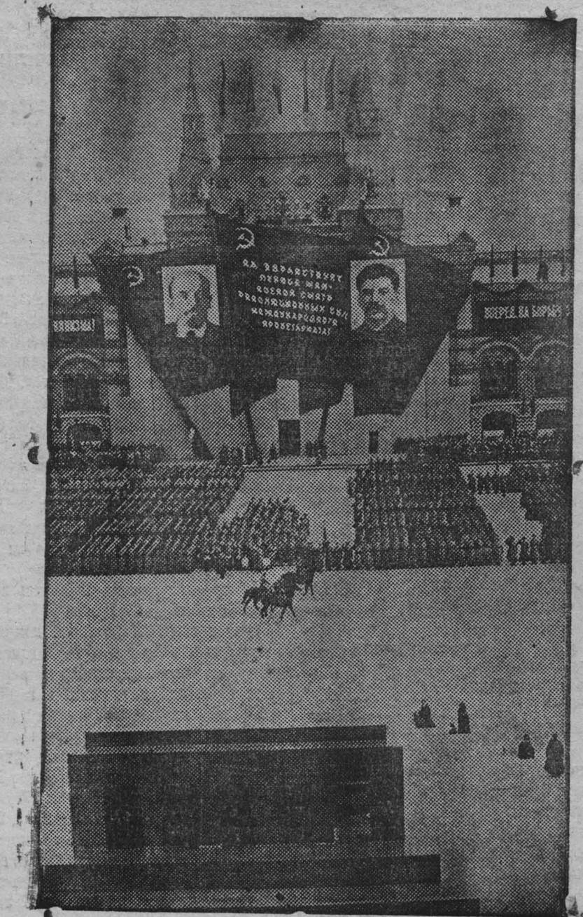
Первомайская демонстрация в Москве. На снимке: парад московского гарнизона на Красной площади.

рочного печенья и пряников. В первом мае было изготовлено 5 тыс. пряников, много пряников и других кондитерских изделий.