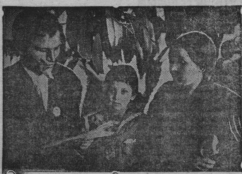
Рабкор—отличник Центральной шахты г. Алюпов в кругу своей семьи.