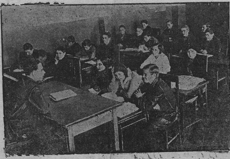
Политзанятие лучшей группы слесарей школы ФЗУ мехзавода.