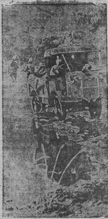
НА СНИМКЕ: продвижение итальянского грузовика по бездорожью в провинции Тигре (северный фронт). Промитивные каменные насыпи загромождают мосты.

22 ноября корреспондент «Дейли телеграф» получил разрешение пролететь на собственном самолете огаденским фронтом и посетить абиссинские позиции в Джиджиге и Дагга-Буре. Корреспондент так же пролетел итальянскими позициями у Гораях. Наблюдения корреспондента доказали неопровержимо, что итальянские сообщения, сделанные еще две недели назад о занятии ими Сасса-Бене и Дагга Бура, были лишь «пропаган-