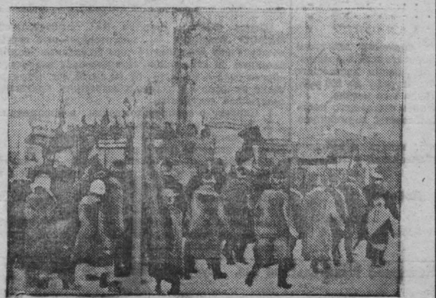
Октябрьская демонстрация в Кемерово.