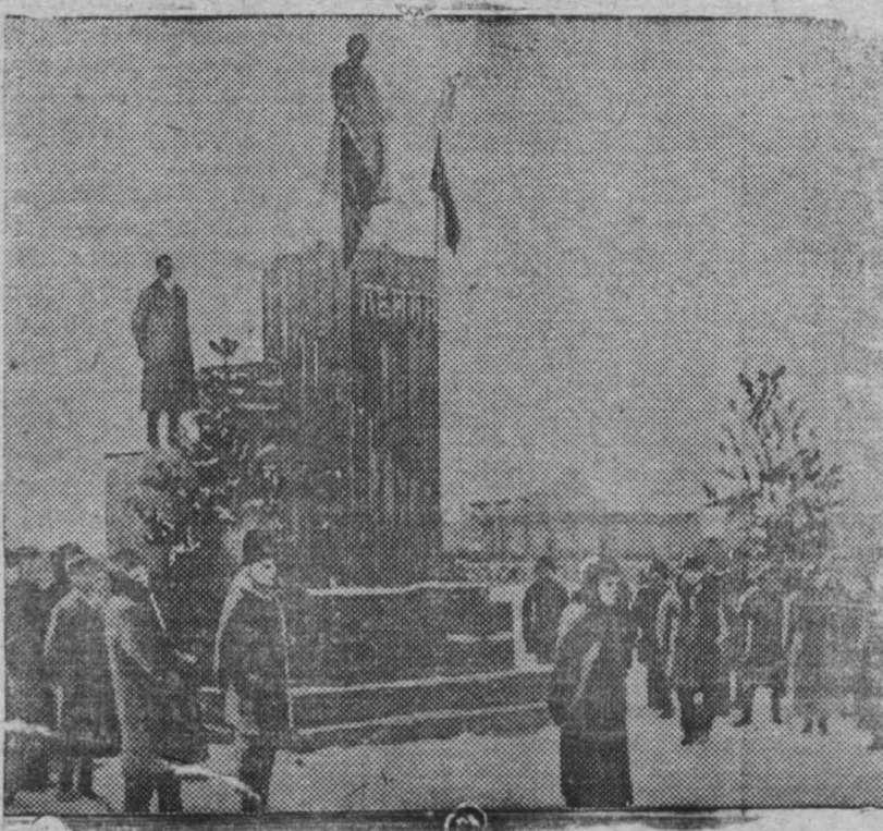
Открытие памятника В. И. Ленину

—Трудящиеся Кемерово вместе со всей страной демонстрировали свою преданность коммунистической партии и ее вождю товарищу Сталину, демонстрировали свою готовность выполнить любое задание партии и правительства, защитить грудью свою великую родину, добиться полного построения бесклассового социалистического общества в нашей стране.