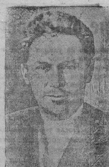
Перед горняками шахты Центральной поставлена задача: перекрыть проектную мощность, довести добычу до 1800 тонн в сутки. За выполнение этой задачи горняки Центральной шахты борются с большевистским упорством.

Работая в направлении выполнения этих задач и развивая стахановское движение Центральная шахта в октябре стала перекрывать проективную мощность, доводя в отдельные дни добычу до 1700 тонн, выполнив досрочно план угледобычи в октябре.