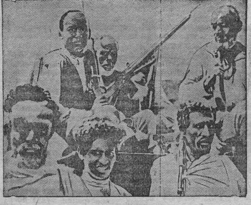
На снимке: три поколения абиссинцев—дед, отец и сын—отправляются из Харара на сборный пункт абиссинских войск.

По сведениям из абиссинских источников, абиссинцами сбит итальянский бомбовоз в районе Дага-Бур.