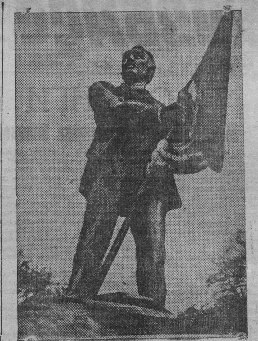
18 октября 1905 г. (старый стиль) в Москве был убит на улице Чернышевского видный революционер, большевик Николай Эрнестович Бауман накануне освобожденный из Таганской тюрьмы. Похороны Баумана (20 октября) превратились в небывалую в Москве политическую демонстрацию, в которой участвовало до 200 тыс. человек. НА СНИМКЕ: новый памятник Н. Э. Бауману, поставленный в 1935 г. в саду культуры и отдыха его имени (Баумановский район в Москве).

Машинисты-кривоносцы Донецкой железной дороги. слодует 500 подписей.