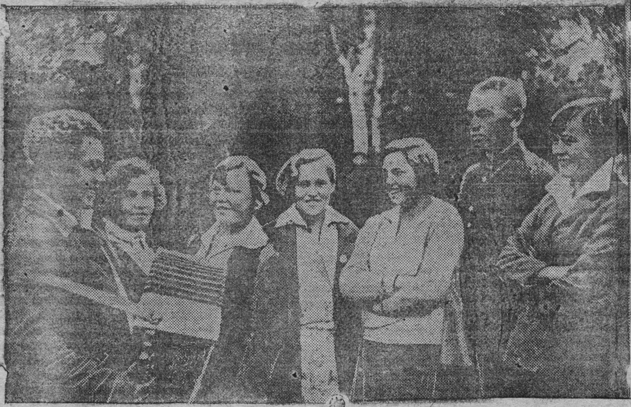
Колхоз "Работник" вторым в районе получил государственный акт на вечное пользование землей. Ко дню вручения акта колхоз полностью выполнил обязательства перед государством. Радостно было на празднике. Не только молодежь, но и взрослые колхозники принимали участие в танцах, плясках под оркестр духовой музыки. На снимке: группа молодежи поет частушки под гармошку.