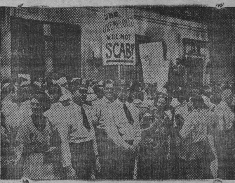
2500 служащих окружили здание «Администрации чрезвычайной помощи» в Нью-Йорке (США) и держали его в осаде 3 часа в связи с декретом о снижении пособий. В результате этой осады и ряда демонстраций администратор ген. Джонсон распорядился отпустить свыше миллиона долларов для распределения среди безработных по 13 долларов каждому, не протрешая вопроса об их удержании при выплате пособий. На снимке: осада «Администрации чрезвычайной помощи».