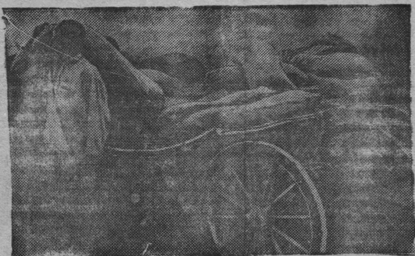
Хлебороса на Кемеровском пункте Заготзерно