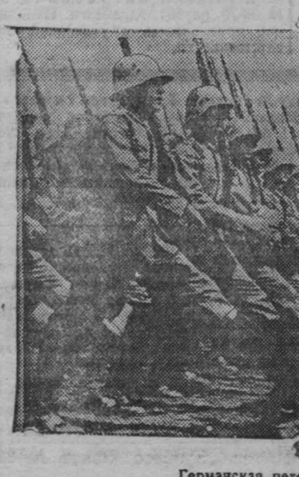
Германская пехота на учении.

В международный антивоенный день пролетариат и угнетенные народы всего мира еще теснее спланиваются свои ряды на борьбу с зачинщиками мировой войны.