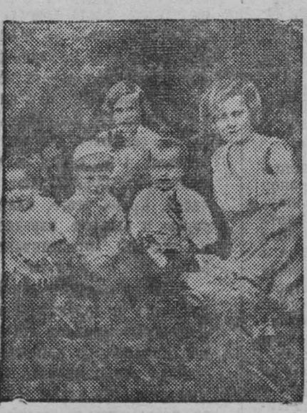
Дети с родителями на общегородском гулянии в парке.