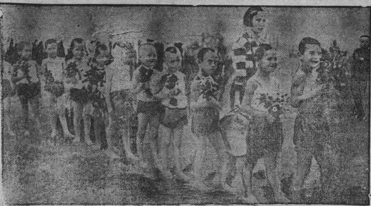
Образцовый мастер шахтеров Центральной шахты. Дети на прогулке.

МОСКВА, 19 июля (ТАСС). "Правда" сообщает, что 19 июля работники Дирижаблестроительного завода т. Сталину, Молотову, Ворошилову, Андрееву, Чубарю и руководителям аэрофлота о постройке нового полужесткого дирижабля "В-7". "Челюскинец" объемом 9500 кубометров и об окончании испытаний полужесткого корабля "В-6" "Осоавиахим" объемом 18500 кубометров. На днях новый воздушный корабль "В-7" совершил первый пробный полет. Несмотря на дождь и большую облачность "Челюскинец" показал высокие летные качества. Новый дирижабль скоростной корабль. По своей конструкции он значительно отличается от всех построенных у нас до сих пор дирижаблей. Корабль проектирован, построен и собран главным образом силами молодых советских инженеров. Сборка дирижабля произведена в рекордный срок—два месяца.