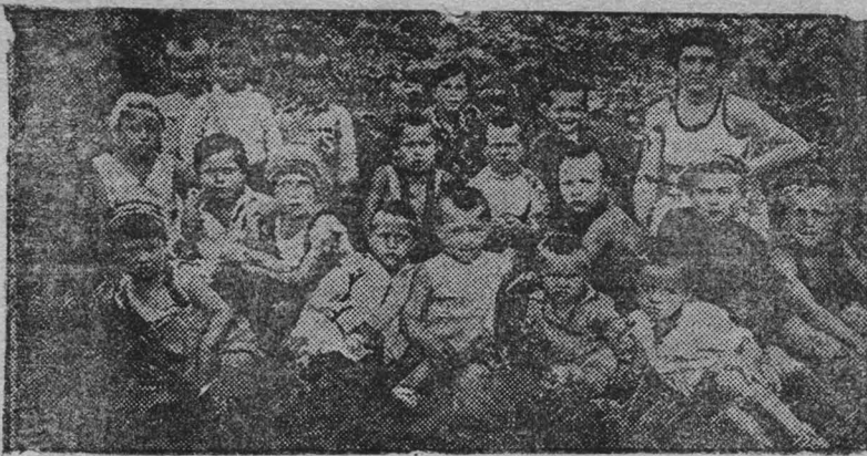
Детские ясли отдыхающих дома отдыха на прогулке.

РИМ, 16 июля (ТАСС). По сообщению итальянской печати советский пароход «Каменич Подольск» спас в Адриатическом море человека, жертву кораблекрушения. По словам спасенного он в течение пяти дней держался на обломках разбитого судна.