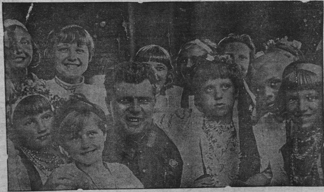
Празднование 15-летия освобождения Киева от польских интервентов. На снимке: герои Советского Союза М. В. Водопьянов среди детей в парке Дворца пионеров им. Постышева.