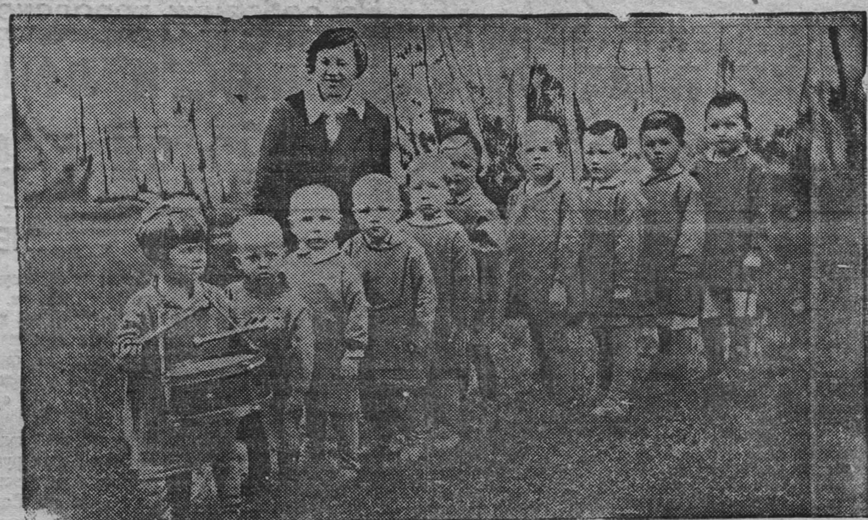
Дети образцового детсада рудника на прогулке.