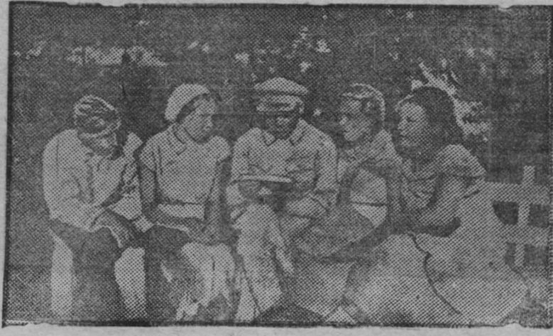
На аллеях сада коксохимзавода. Группа рудничных комсомольцев-активистов, прибывших на собрание городского актива, за чтением газет.