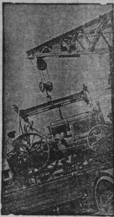
Сталинградскому тракторному заводу пять лет. На снимке погрузка тракторов.

Данные межрайонных комиссий предварительные. Они потребуют некоторого уточнения, но сейчас можно уверенно сказать, что на полях зреет богатейший урожай. Его надо сберечь и хорошо убрать.