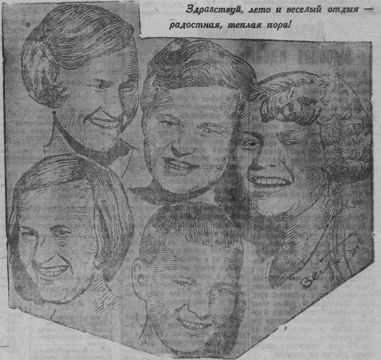
Здравствуй, лето и веселый отдых — радостная, теплая пора!