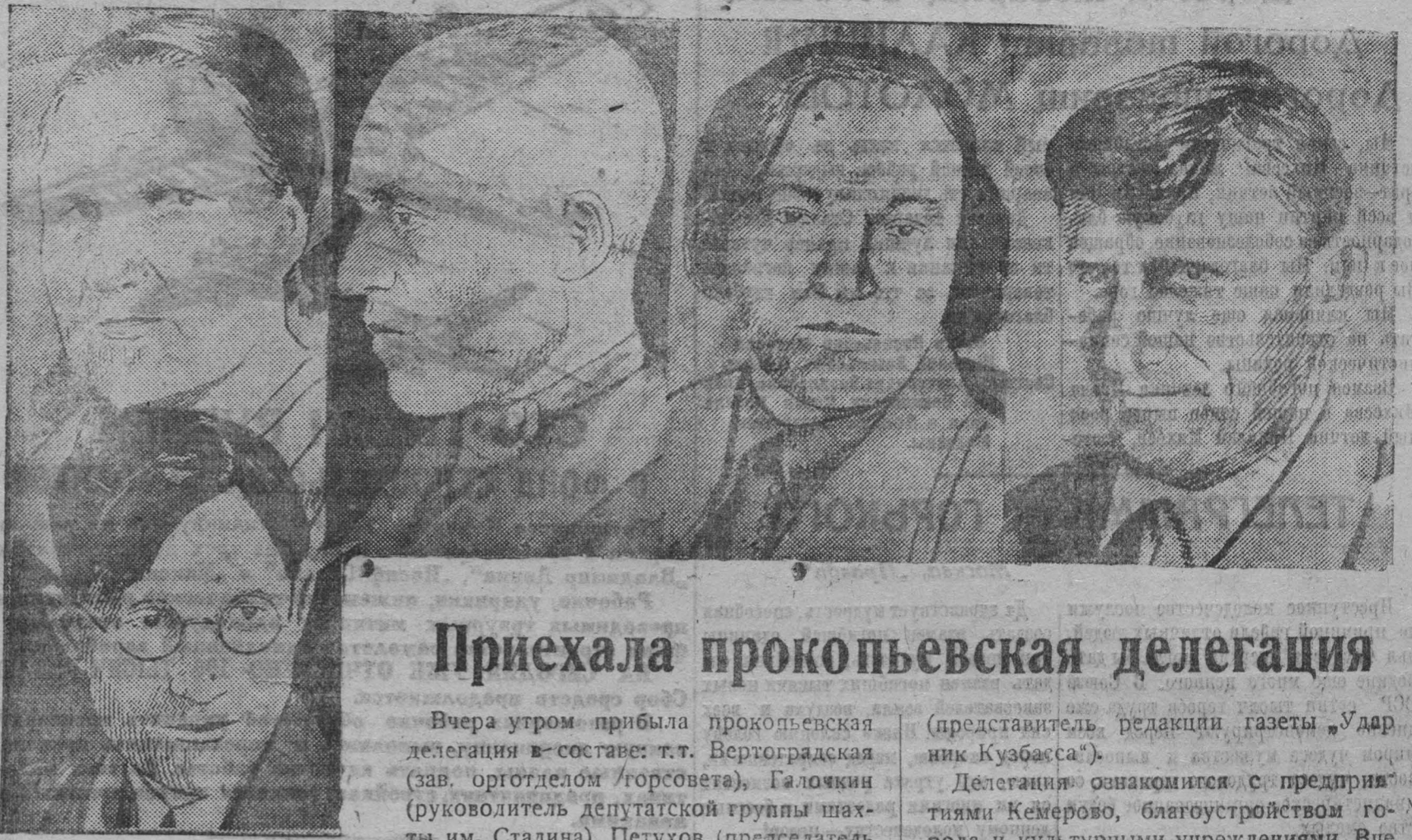
На снимке делегация Прокопьевская