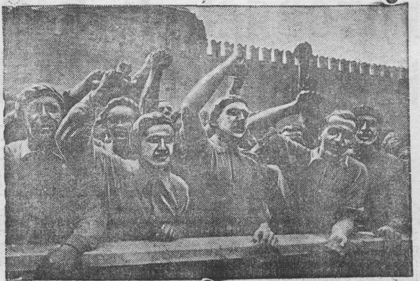
Австрийский шубунт на Красной площади

В восстановлении президиума крайисполкома об утверждении решения слета городских и поселковых советов о культурно-бытовом минимуме говорится: «Обеспечить выполнение принятого слетом решения, мобилизуя на это широчайшие массы рабочих».