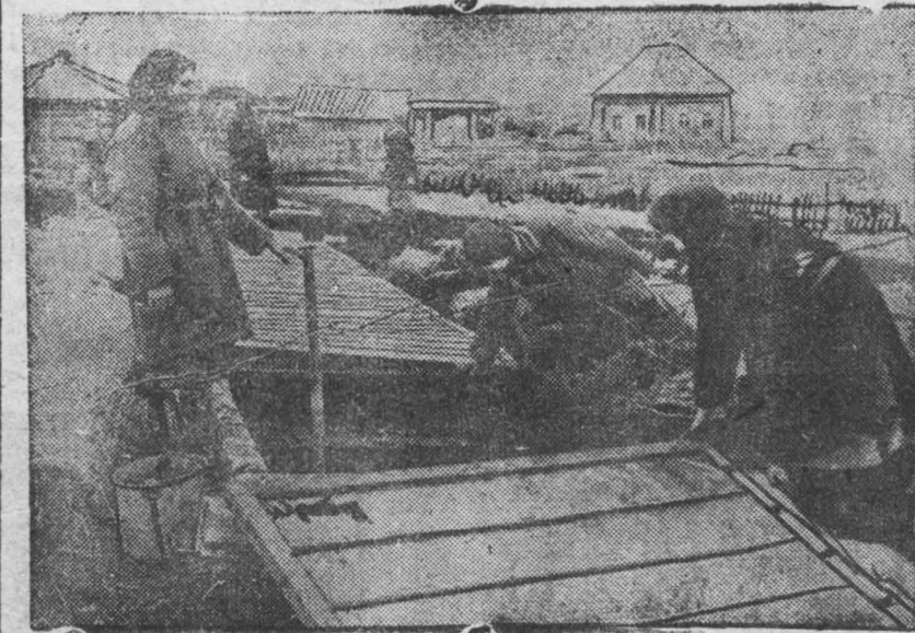
НА СНИМКЕ: посадка помидор на рассаду в парник в колхозе «Карла Маркса»

25 апреля колхоз «Серп и молот» Верхне-Томского сельсовета (правобережный) приступил к сверхраннему севу. Посеяно пшеницы 2,36 га. Сев проведен в грязь. Одновременно с этим началась повторная проверка готовности к выезду в поле на массовый сев. Семенной материал давно отсортирован, протравлен и проверен на всхожесть. Пшеница имеет всхожесть—98 проц., овес—96 проц. Рабочая сила на бригадах расставлена, инвентарь и лошади закреплены за бригадами и за каждым колхозником. Оставшиеся дни до выезда в поле превратились в дни политической подготовки. В бригадах организованы стенгазеты, проводятся политички, беседы и проработка материалов 17 партсъезда. Каждый комсомолец получает конкретное задание, которое ежедневно проверяется. Массовый сев намечают провести в 12-15 дней, наша хорошая подготовка к севу это обеспечивает. Предколхоза Шубенко. Бригадир Рыбанов.