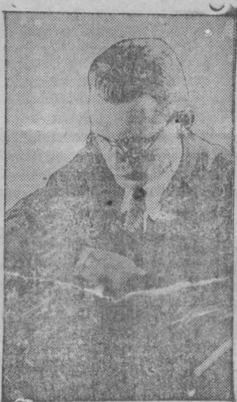
Чемпион СССР по шахматам тов. М. Ботвинник выехал 19 декабря в Англию для участия в международном шахматном турнире в Гестинге. На снимке: М. Ботвинник.