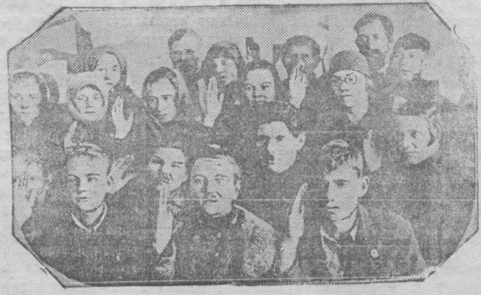
На мехзаводе. Избиратели голосуют за своего депутата в горсовет