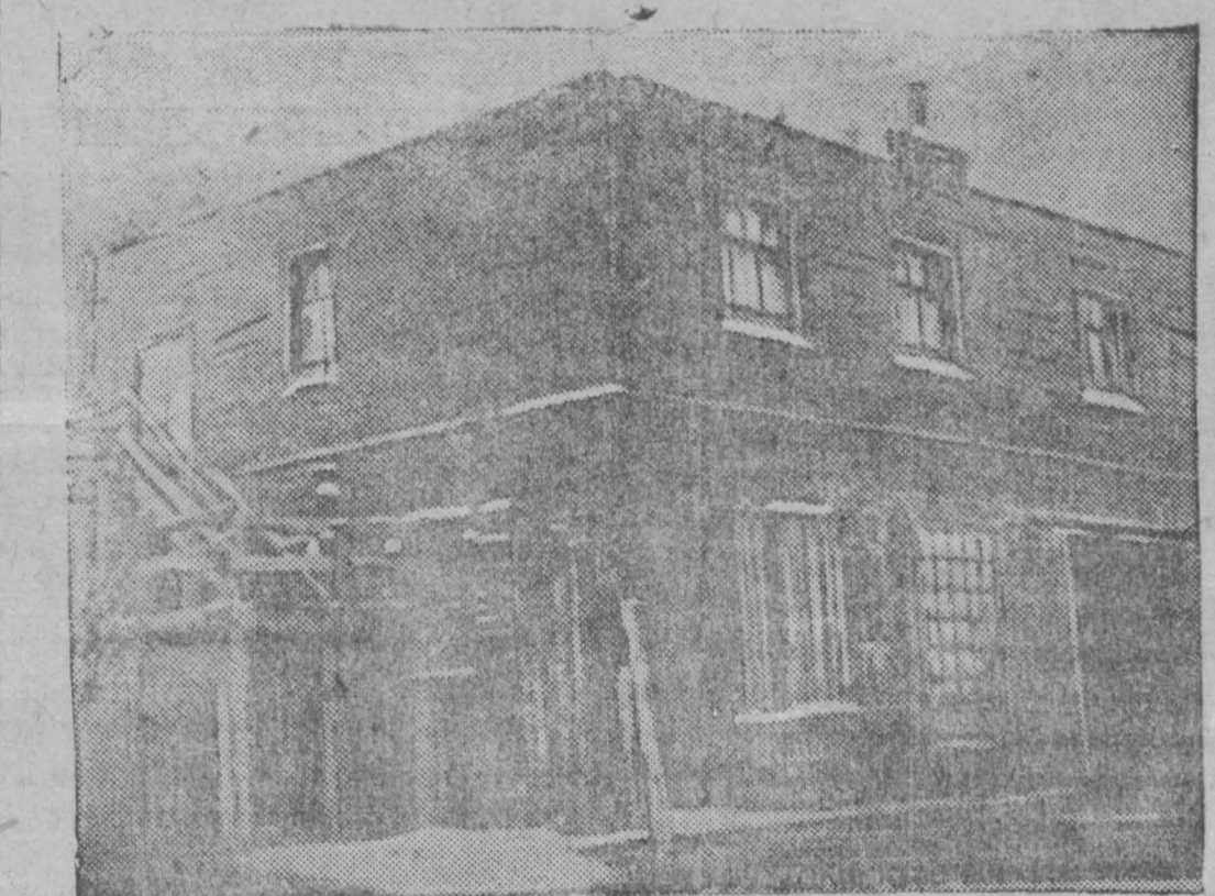
Строятся новый гараж на площади Дворца труда.

Артель «Кежобувь» выпустит за первый квартал 1935 года 800 пар обуви для взрослых, 890 пар детской и школьной обуви. Производит венный план на первый квартал 1935 года увеличен против плана четвертого квартала на 8 процентов.