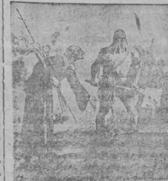
Белички инквизитор: — Вы перешеголяли мися, господа фашисты. (ком. правда)

ЖЕНЕВА, (ТАСС). 21 ноября министр иностранных дел Франции Лаваль посетил Литвинова, с которым имел продолжительную беседу.